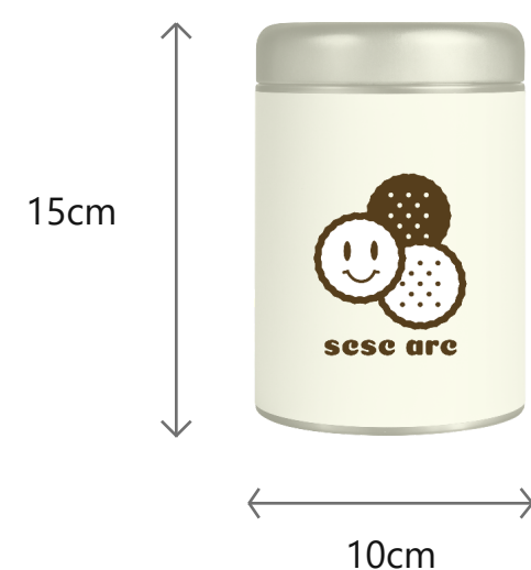
詰め合わせ用缶イメージ図